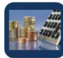
Проверка налоговой задолженности