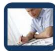
Подача налоговой декларации