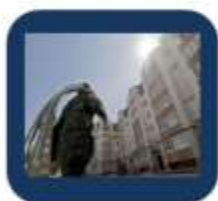
Оплата услуг ЖКХ