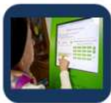
Запись на прием к врачу