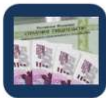
Проверка пенсионных накоплений