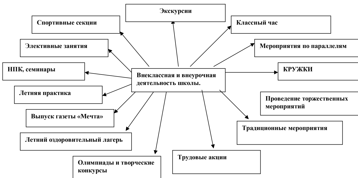
Схема 1. Виды внеклассной и внеурочной деятельности.

«Воспитание школьника способного к духовному и физическому саморазвитию, совершенствованию и самопознанию» - тема воспитательной работы школы. В школе действует программа развития воспитательного пространства 2017-2018 гг., разработана концепция воспитательной работы на текущий учебный год и составлены планы воспитательной работы в каждом классе. Планирование происходит с учетом возрастных особенностей обучающихся, их интересов и потребностей. Повышать качество воспитательной работы можно разными способами, совершенствуя положительное, развивая достигнутое, преодолевая недостатки, предупреждая ошибки, но нужно помнить, что воспитательный процесс – это профессионально организованная, целостная совместная деятельность педагогов, родителей и детей, что немаловажную роль в этом процессе играет классный руководитель.